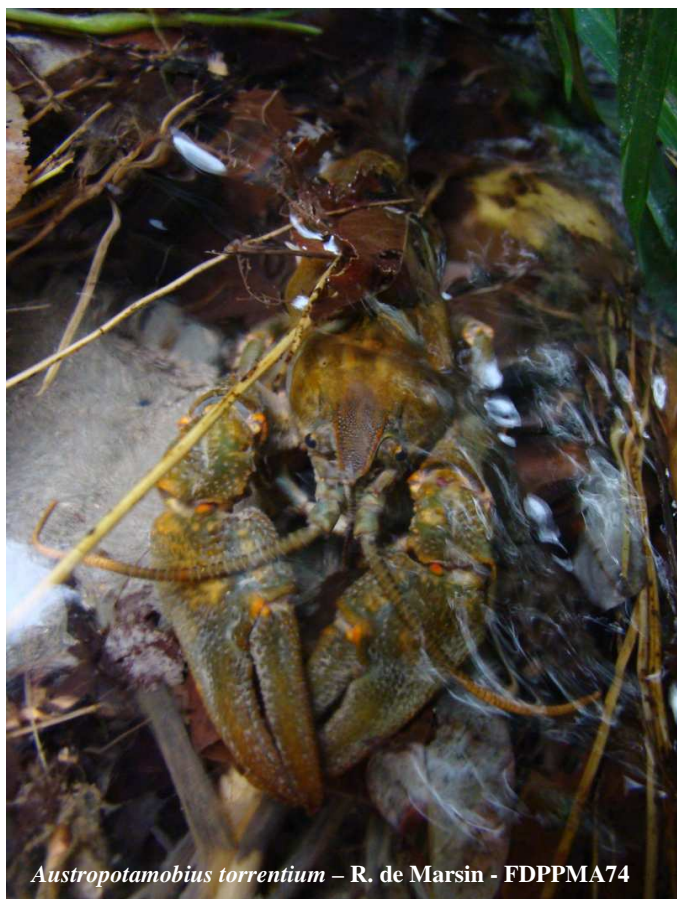
Austropotamobius torrentium

- Qu'il serait fait mention sur l'arrêté préfectoral de rejet que si la CCS souhaitait dépasser les 500EH dans le cadre de perspective de développement, un déplacement significatif du point de rejet à l'aval du bassin serait à prévoir.