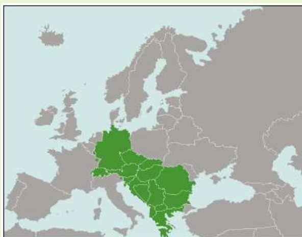
Aire de répartition de l'écrevisse des torrents (Holdish, 2002)

En France, l'espèce a été considérée comme disparue jusqu'en 1995, où trois populations ont été identifiées en Lorraine et en Alsace. Seules deux de ces populations étaient encore présentes en 2006, toutes deux situées dans le périmètre du Parc Naturel des Vosges du Nord, l'une en Moselle, l'autre dans le Bas-Rhin (Collas & al., 2007). La population identifiée sur le ruisseau de Marsin est donc la troisième population connue en France, et la plus méridionale des trois.