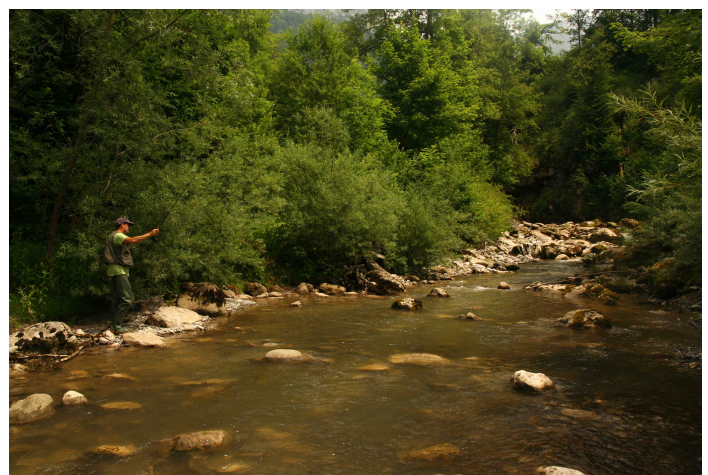
La Fillière

La Fédération a appris qu'un projet de station d'épuration était en cours aux sources du ruisseau du Marsin. Or, ce ruisseau héberge la seule population d'écrevisses de torrents du département, l'une des deux seules en France. Pour s'assurer que ce projet ne nuise pas aux écrevisses et à la qualité globale du ruisseau, la Fédération a demandé des précisions aux services de l'Etat, sur les études d'impact prévues.