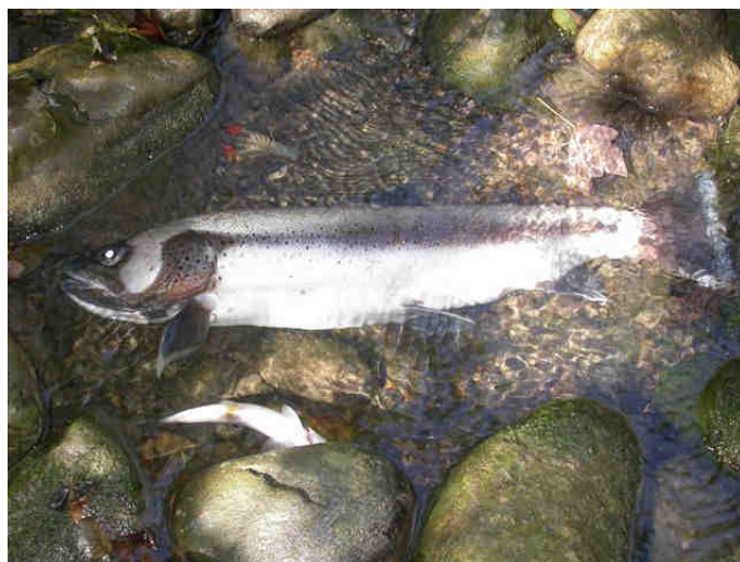
Traites et écrevisses sont mortes sur 6 à 7 km de rivière

Ce suivi sera effectué par la Fédération mais les mesures seront prises par le gestionnaire de la pêche, qui est l'AAPPMA du Chablais Genevois. En parallèle, la Fédération a interrogé les services de l'Etat sur le risque de toxicité pour l'homme lié à la consommation de poisson de la Menoge ; nous sommes en attente de la réponse.